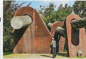
Stahl und Granit: Eine Skulptur er- innert im Rats- dienergarten an den Matrosenaufstand

Museum: Schiffahrtsmuseum Kiel, Wall 65, 24103 Kiel, 0431/9013428, täglich von zehn bis 18 Uhr geöffnet, montags geschlossen, Eintritt vier Euro, www.schiffahrtsmuseum-kiel.de